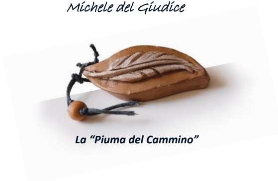
La “Piuma del Cammino”