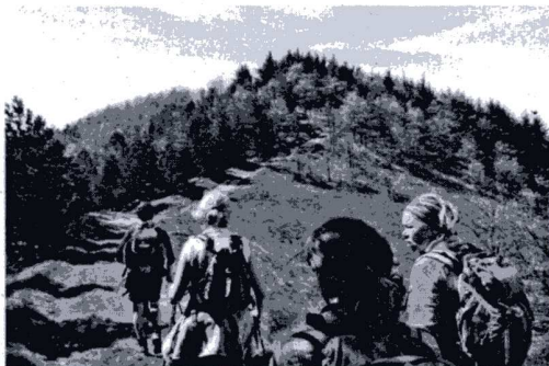
Una delle escursioni passate del CAI Foggia, che conta circa 180 soci